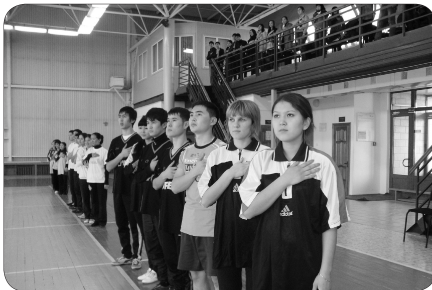
Экономика және басқару факультетінің студенттері салауатты өмір салтын насихаттауда

талабына сай жоғары материалдық-техникалық базамен жабдықталған: оқу ғимараты, компьютерлік сыныптар, интерактивтік тақтамен жабдықталған арнайы аудиториялар, студенттерге