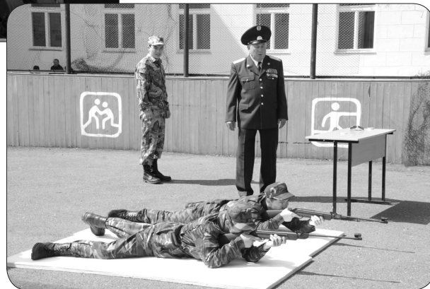
Бастапқы әскери дайындық мамандығының сарбаздары жаттығу үстінде