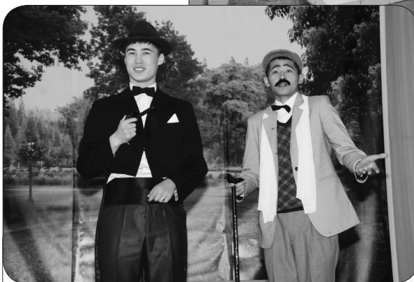
Мерекелік кеште «Серпін» жастар театрының тамаша көңіл-күй сыйлау сәті