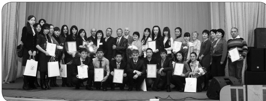
Университетімізде математика пәнінен өткен республикалық олимпиада жүлдегерлері