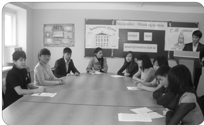
«М.Өтемісовтың өмірі мен шығармашылығы» тақырыбына арналған дөңгелек үстел