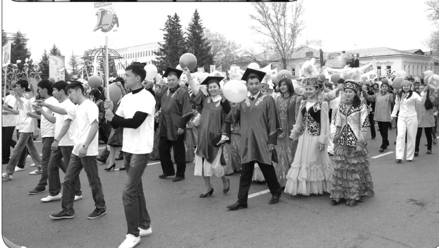
Студент жастар еліміздің Конституциясы күні қалалық шеруде

ҚОЛЖАЗБАЛАР АВТОРЛАРЫНА КЕРІ ҚАЙТАРЫЛМАЙДЫ. ДЕРЕКТЕРДІҢ ДӘЛДІГІ ҮШІН АВТОР ЖАУАПТЫ. ЖАРИЯЛАНЫМ АВТОРЛАРЫНЫҢ ПІКІРЛЕРІ РЕДАКЦИЯ КӨЗҚАРАСЫН БІЛДІРМЕЙДІ.