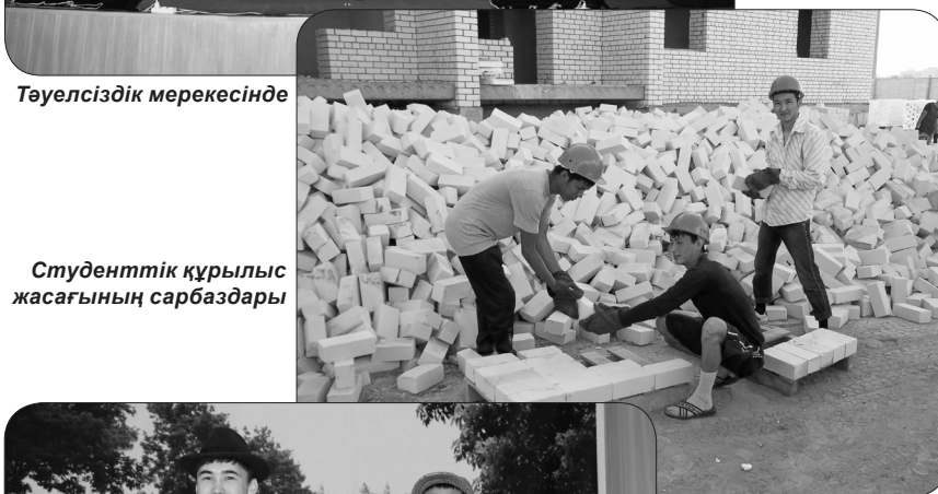
Студенттік құрылыс жасағының сарбаздары