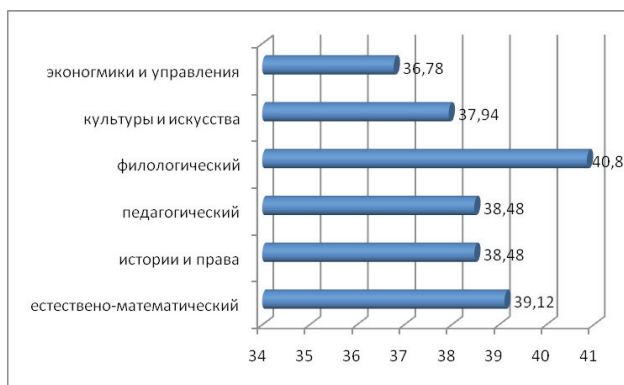
Рис. 2 Процент правильных ответов на тестовые задания по категориям познания у студентов институтов/факультетов ЗКГУ

Сравнительный анализ результатов тестирования в разрезе институтов/факультетов свидетельствует о том, что наиболее высокие результаты у студентов филологического факультета. Процент правильных ответов по всем категориям познания составил 40,86%. Наиболее низкий процент правильных ответов по всем категориям познания у студентов института экономики и управления – 36,78%.