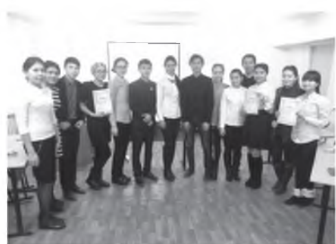
«Болашақты болжаған кемел еңбек!» интеллектуалдық сайысы

Сонымен қатар, 1 желтоқсан Қазақстан республикасының тұңғыш Президент күніне орай 24 қараша күні факультет көлемінде «Болашақты болжаған кемел еңбек!» атты мерекелік кеш пен интеллектуалдық сайысы ұйымдастырылды.