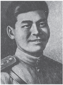
Бауыбек Бұжымшев атындағы жас журналистер клубының жаршысы