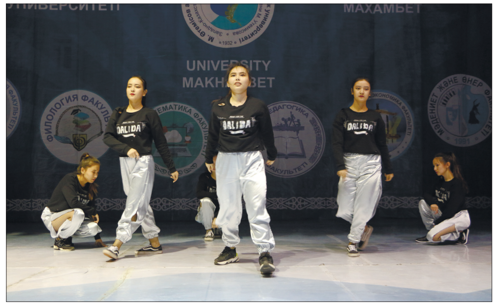
состоялось посвящение в студенты на трех остальных факультетах.

В большом сборном концерте приняли участие студенты старших курсов - лауреаты городских, областных и республиканских конкурсов, слушая которых первокурсники получили представление о том, как в стенах университета можно развить свои творческие способности и стать как девчата из танцевального ансамбля ЗКГУ и ребята из команды КВН «Муррагер», участниками и лауреатами престижных конкурсов. На следующий день