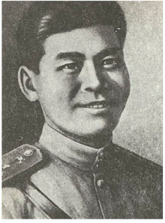
Бaubек Бұлқышев атындағы жас журналистер клубының жаршысы

2016 жылы қаңтардың 30-ынан бастап шығады - Издаётся с 30 января 2016 года