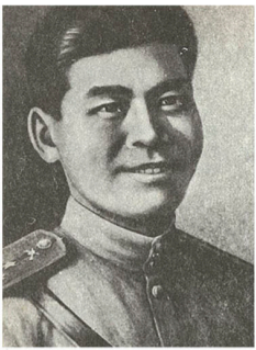
Бaubек Бұлқашев атындағы жас журналистер клубының жаршысы

2016 жылы қаңтардың 30-ынан бастап шығады - Издаётся с 30 января 2016 года