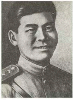
Абубек Бұлықшев атындағы жас журналистер клубының жарғысы

2016 жылы қаңтардың 30-ынан бастап шығады - Издаётся с 30 января 2016 года