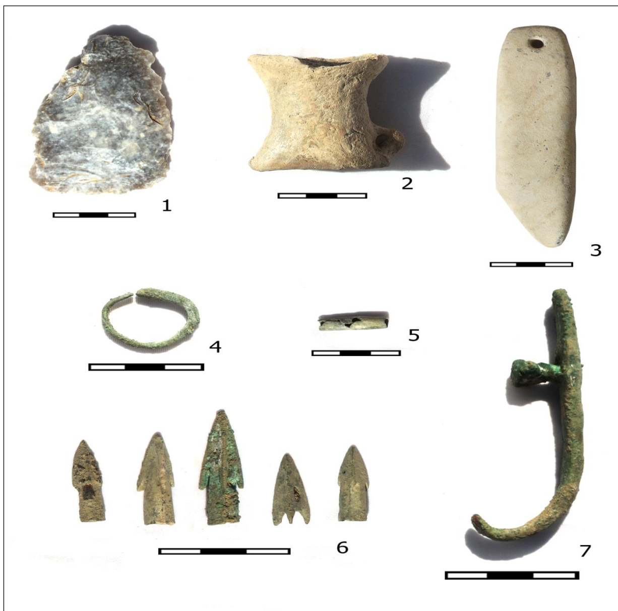
Рис. 1. Курган Акшукур I, погребение 2. Инвентарь (1 – каменный наконечник, 2 – обломок курильницы, 3 – височная подвеска, 4 – пронизка, 5 – наконечники стрел, 6 – колчанный крючок).