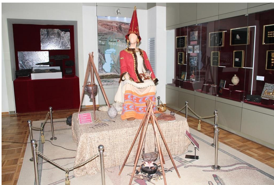
Қосымша 5 Музейдегі Алтын ханшайым-Тақсай ханшайымы экспонаты