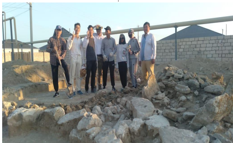
Ақшүкір I қорғанын қазуға қатысушы студенттер. 2020 жыл, Маңғыстау облысы. Жетекші Е.Е.Клышев.