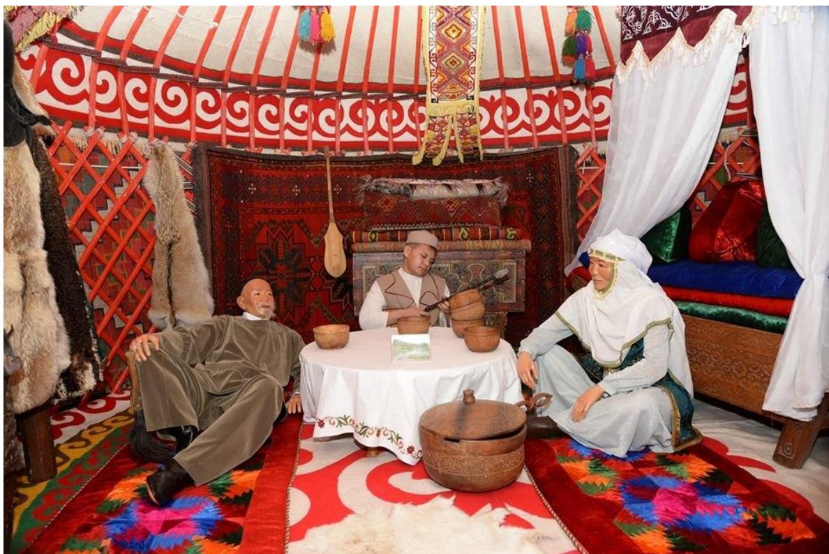
Қосымша 6 Музейдегі Қазақ хандығы залынан көрініс