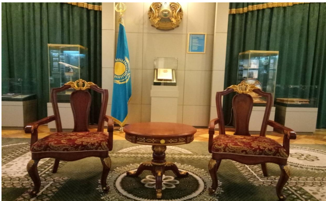
Қосымша 4 Батыс Қазақстан облыстық тарихы өлкетану музейіндегі тәуелсіздік залы