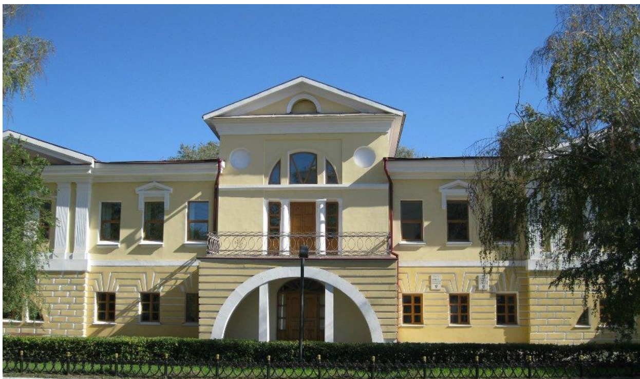
Қосымша 7 Оралдағы БҚО тарихи-өлкетану музейіне қарасты Пушкин музейі